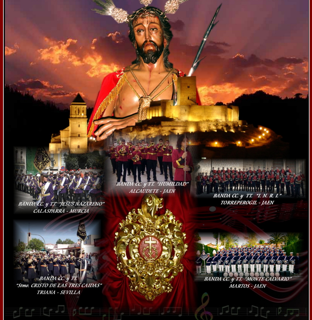
BANDA CC. y TT. "JESUS NAZARENO" CALASPARRA - MURCIA